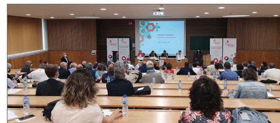
Temps fort mutualiste, l'Assemblée générale de l'Union régionale s'est tenue à Limoges le 1 er juillet 2021.

En 2021, pour poursuivre l'animation de la vie mutualiste, maintenir l'intensité des travaux et des activités malgré la crise sanitaire, les réunions des instances se sont tenues majoritairement en distanciel.