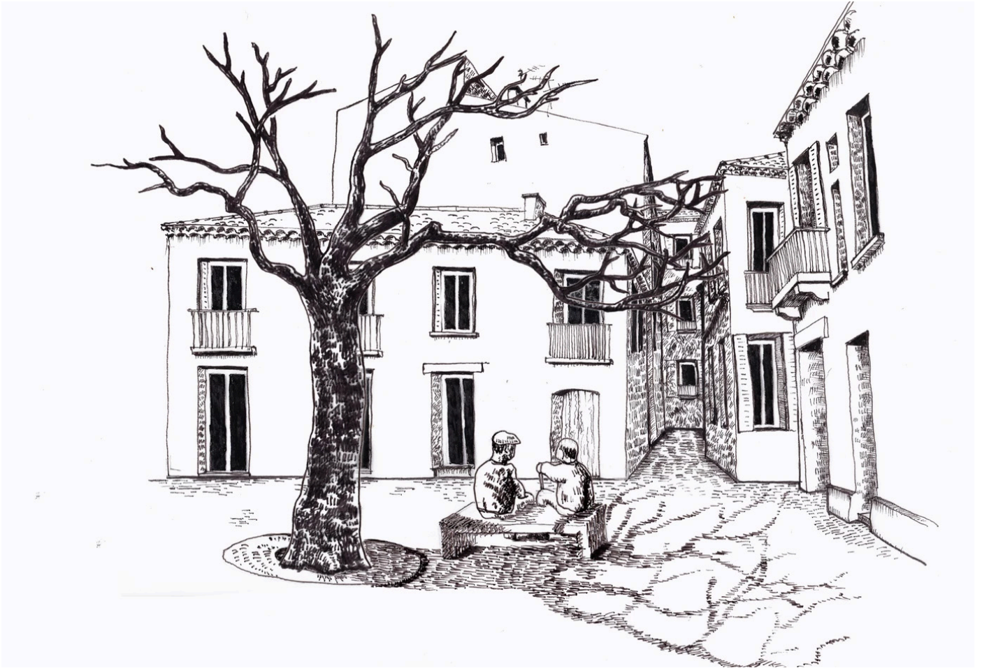
Philippe BENOIT, «l'arbre 2», dessin au feutre, 2019, Languedoc.

Au plus fort de la chaleur, quand la goutte de sueur du bouliste mouille les pierres, elle s'évapore. Cette fraîcheur mêlée à la transpiration de l'arbre forme le phénomène «d'évapotranspiration», une climatisation naturelle que les villes traditionnelles du Sud ont su maîtriser pour survivre à l'été.