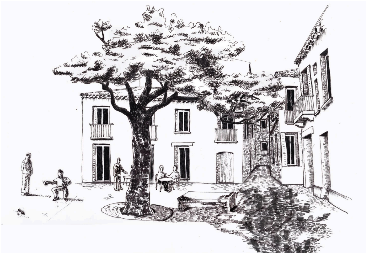
Philippe BENOIT, «l'arbre 1», dessin au feutre, 2019, Languedoc.

77,5% de la population est urbaine (1). Pourtant la plupart des habitants ignore ce qui constitue la ville, et n'imagine pas ce qui pourrait y être aménagé pour qu'elle résiste mieux aux dérèglements climatiques. Prenons un élément banal pour démarrer cette réflexion : un arbre.