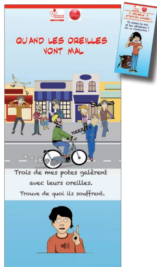
Retrouvez l'ensemble des panneaux de l'exposition sur www.aquitaine.mutualite.fr

Enfin, lors de manifestations publiques, avec d'autres acteurs de prévention, elle a sensibilisé des musiciens et des jeunes aux risques liés à l'écoute de la musique amplifiée.