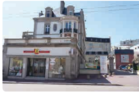
Mutualité Française Limousine 39 avenue Garibaldi - 87000 Limoges

Les services de soins et d'accompagnement mutualistes (Ssam)