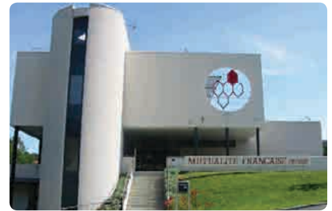
Mutualité Française Creuse 1 rue Charles Chareille - 23000 Guéret