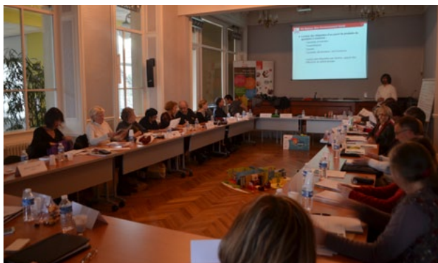
Formation sur la santé environnementale 03.12.15

La dernière formation de l'année 2015 portait sur une thématique d'actualité au moment de la COP 21 : la santé environnementale (formation annuelle proposée par le service prévention).